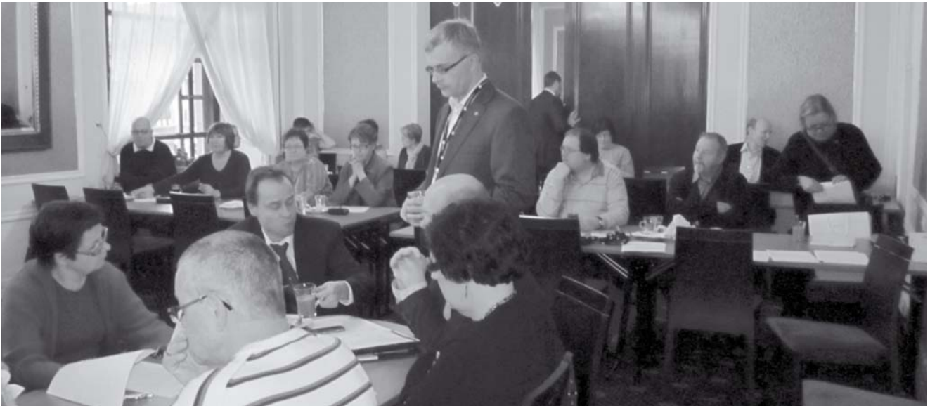
Logistiikan toimihenkilöiden syyskokous keräsi Helsinkiin 40 aktiivia ympäri maata.

Tulevana juhlavuonna Logistiikan toimihenkilöt arvostaa perinteitä, vaalii nykyisyyttä ja kehittää toimintojaan. Tavoitteena on entistä vahvempi ja yhtenäisempi yhdistys.